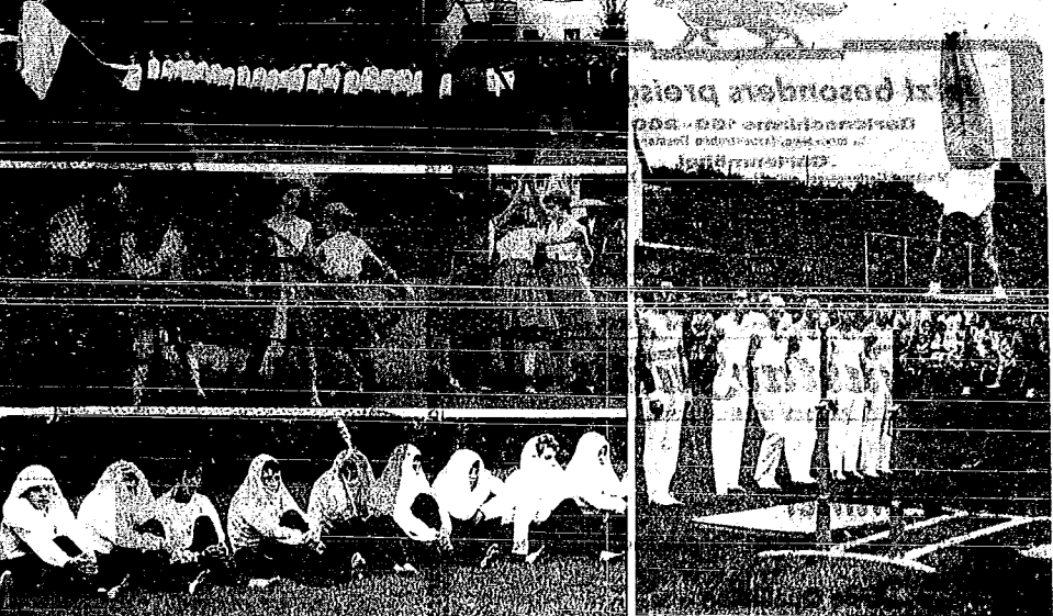
Vier Bilder vom schwedisch-deutschen Jugendturnertreffen in Weinsberg am vergangenen Donnerstagabend auf dem Grasplatz bei der neuen Turnhalle. Angeführt von den Trägern der Nationalflagge beider Länder zogen die Turner auf (links oben); Weinsberger Mädchen beim Volkstanz, für den sie starke Beifälle erhielten (links mitte); der teilweise niedrige Regen konnte die produktive Schwedischer Vorführungen nicht stören, Schwedens Mädchen versuchten ihre Putts Jugs in ein provisorisches Regeneck (links) auf einem bescheidenen Niveau standen auch die Leistungen der Turner am Barren (rechts)

Die etwas ungelieblichen Raumverhältnisse und das Benutzen der in zwei Jahren schon 100 Jahre bestehenden Fabrik des Ziegeltreibs werden ausgebaut, führen zum Neubau einer Werkhalle, die Anfang August in Betrieb genommen werden kann. Die neuen, in der Jagsttalneue liegenden Fabrikationsräume haben eine Gesamtausdehnung von ca. 12 auf