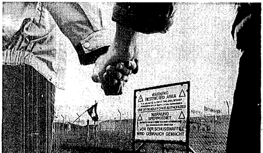
Symbolgestolen auf der Waldheide: Zusammenhalten!