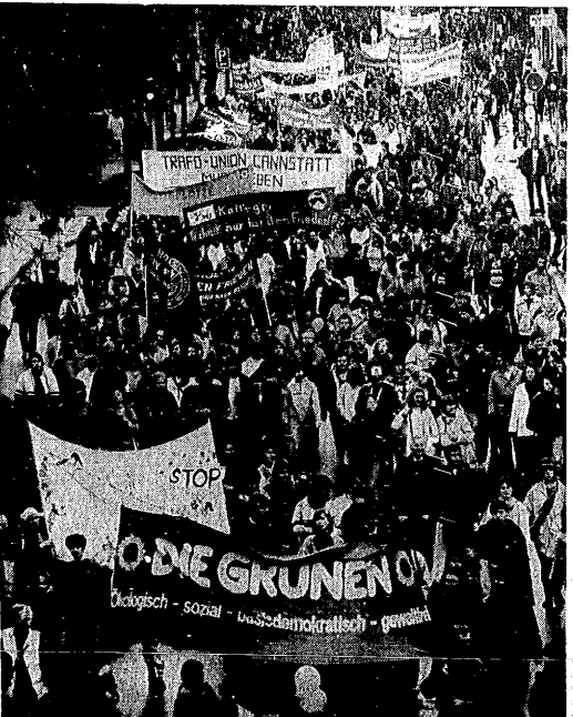
Kilometerlang war der Demonstrationzug, der sich von Waldheide und Theresienwiese auf den Marktplatz zubewegte.