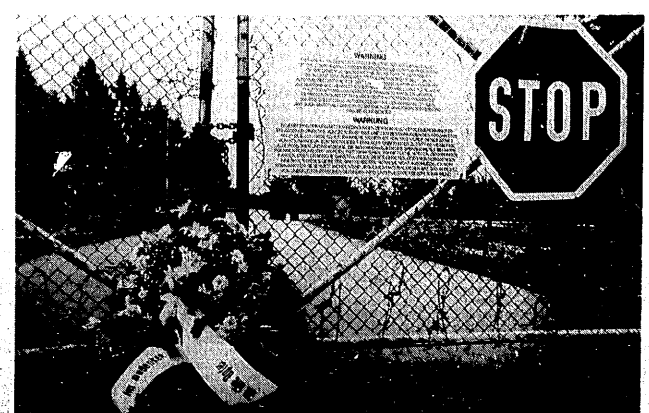
Für die drei beim Raketenunglück gestorbenen US-Soldaten wurde am Haupttor von Demonstranten ein Kranz niedergelegt.