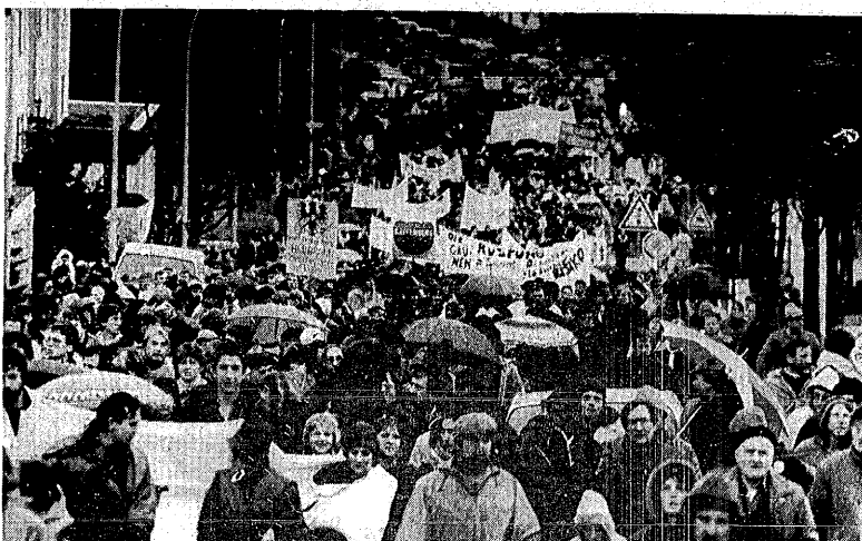
Als die ersten Teilnehmer am Schweigmarsch bereits den Jägerwald erreicht hatten, war das Ende des Zuges noch beim Trappensee. Beteiligt hatten sich ganze Familien, für eine Demonstration auffällig waren die vielen älteren Mitbürger, die sich auch von dem stürmischen Regen nicht hatten abhalten lassen, den einstimmigen Gemeinderatsbeschluss durch ihre Beteiligung am Schweigmarsch zu unterstützen.

Einzelne bekundeten ihre Meinung auf Schildern. Andere - wie die Betreuer der Kinderfreizeiten auf dem Gaffenberg - brachten ihre Meinung in einem offenen Brief zum Ausdruck. Ihnen schlen es „unmöglich, während der Wintererholung zur Tagesordnung überzugehen“. Durch den Unfall sei ihnen „drastischer denn je“ vor Augen geführt worden, welche Gefahren während der Frotzelen drohen. Deswegen würden sie auch in Zukunft alles in ihrer Macht stehende unternehmen, „um den Gaffenberg auch weiterhin als Kinderparadies zu erhalten“. Der „Heilbronner Appell“ mit der Forderung nach dem Abbau aller Atomraketen und einem ABC-Waffen-freien Europa wurde von 77 Gaffenberg-Betreuern unterzeichnet.