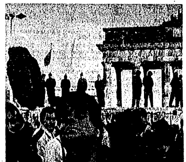
Zu Tausenden drängten gestern die Berliner über den neuen Grenzübergang am Potsdamer Platz, der in der Nacht zuvor aus der Mauer gebrochen worden war