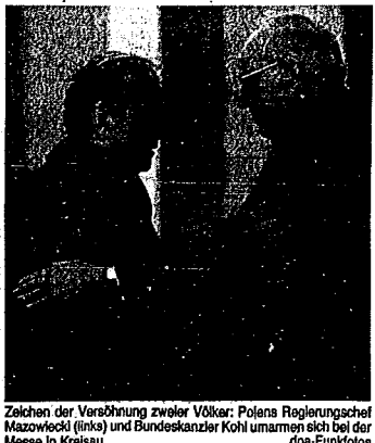
Zeichen der Versöhnung zweier Völker: Polens Regierungschef Mazowiecki (links) und Bundeskanzler Kohl umarmen sich bei der

cheln und anderen die Hand reichen. Kohl und Mazowiecki umarmten sich dann noch demonstrativ unter dem Beifall der Menge.